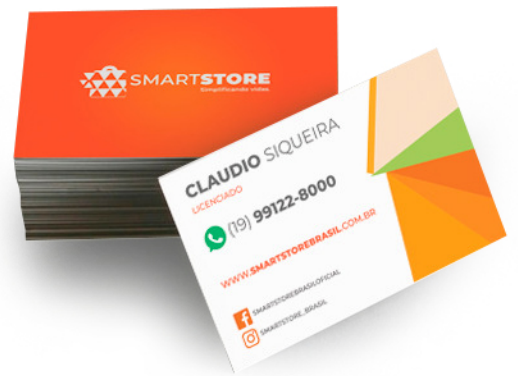
Cartão de visita