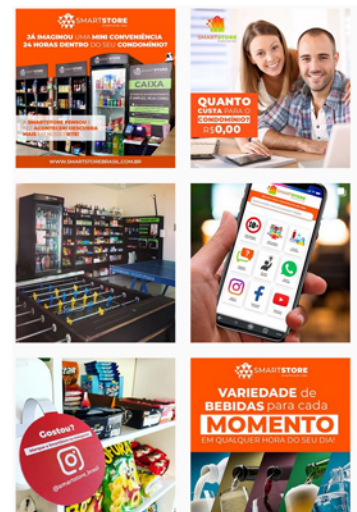
Artes para rede social